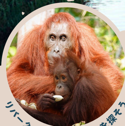
リバークルーズで野生動物を探そう

～森の中でのホームステイでオランウータンやNGOに出会い 森林保全について一緒に考えよう～