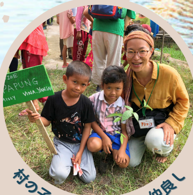
村の子どもと植樹して仲良し