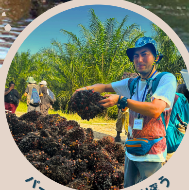
パーム油の問題を学ぼう

オランウータンの棲む豊かな森と アブラヤシ農園の狭間にある村での ホームステイを通して、 急速に進む経済発展と森林保全 について考えるエコツアー